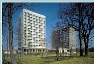
La résidence Cormontaigne construite au début des années 1960 par Jean Dubuisson (aujourd'hui détruite)

voie ferrée électrifiée, Moselle canalisée et autoroute. En raison de l'extension du territoire communal vers ses franges, naguère occupées par des villages vigneronniers et des maisons de villégiature, Thionville absorbe en trois vagues successives les anciens villages de Veymerange, Volkrange, Guetrange, Garche et Koeking... Après 1975, la ville se tourne vers de nouveaux secteurs d'activité en lien avec les bassins d'emploi de Metz et surtout du Luxembourg dans un contexte européen grandissant.