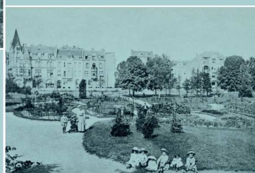
Parc de la Roseraie au début du XX e siècle

Après la Seconde Guerre mondiale, la ville connaît un essor considérable lié au contexte politique et économique des « Trente Glorieuses ». Elle atteint 43 000 habitants en 1975 (soit quatre fois plus qu'en 1900). Renforçant sa vocation de ville industrielle et d'échanges, la ville est pourvue de toutes les infrastructures de circulation alors en usage :