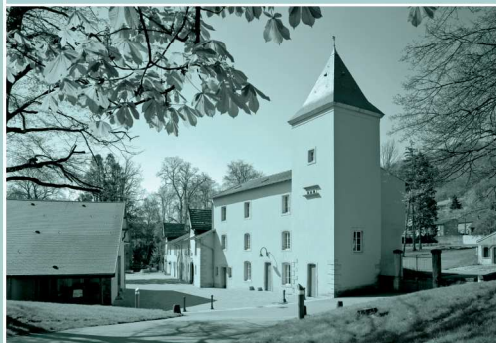
Château de Volkrange, bâtiment élevé en 1741 : communs, pigeonnier et écuries. Derrière, subsiste un ancien vivier.

Une importante immigration allemande apparaît et la population atteint 10 000 habitants vers 1900. Ville frontière allemande, Thionville entre dans le système de la ceinture de Festen avec la construction de l'exceptionnelle Feste de Guetrange.