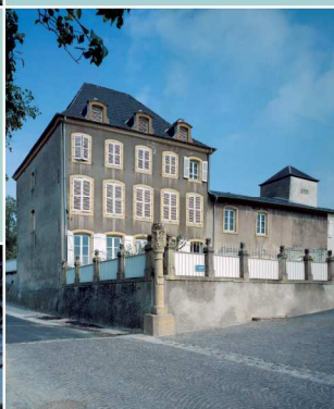
Guetrange, Maison de maître datée du XVIII e siècle avec terrasse dont la grille porte la date de 1819